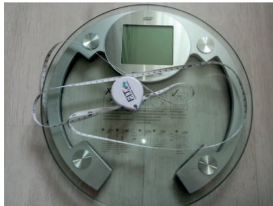
L'obésité atteint 6 à 7% d'hommes et 8 à 9% des femmes à l'âge adulte, d'après Doctissimo.fr .

L'intervention se fait sous anesthésie générale. La durée d'hospitalisation varie de deux à dix jours en fonction du type d'intervention et de l'état général du patient. Après l'intervention, le poids diminue jusqu'à 12 à 18 mois. Au-delà, on peut reprendre du poids. Toutefois, il ne faut pas oublier de prendre des suppléments médicamenteux pour éviter des carences nutritionnelles et des complications neurologiques graves.