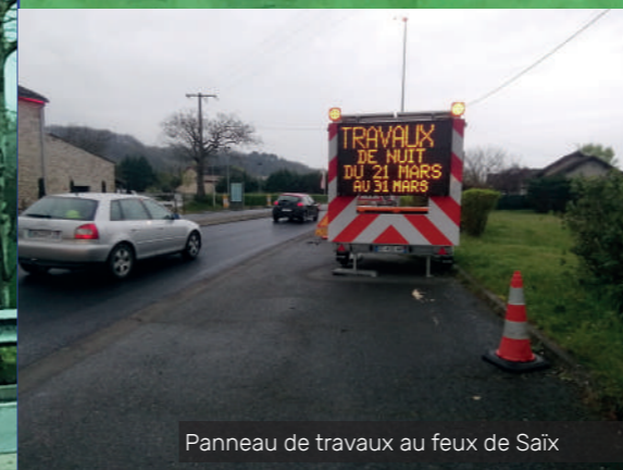
Panneau de travaux au feux de Saix