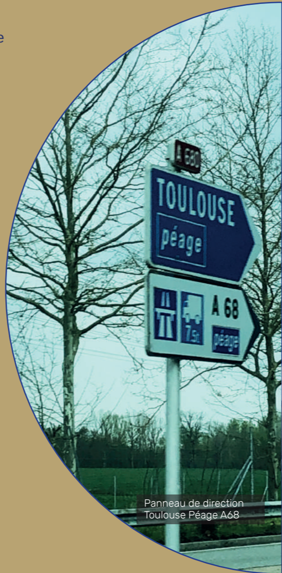
Panneau de direction Toulouse Péage A68

l'autoroute puis ce sera à VINCI de l'entretenir. Grâce à l'autoroute, le trajet Castres-Toulouse passera de 78 km à 46 km. Cependant le péage coûtera 7,50 euros.