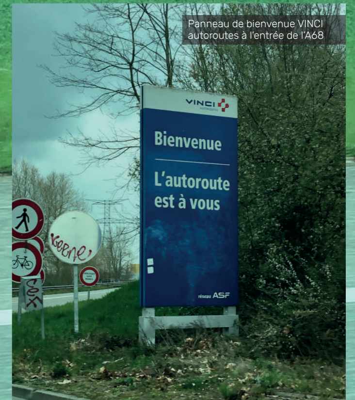
Panneau de bienvenue VINCI autoroutes à l'entrée de l'A68