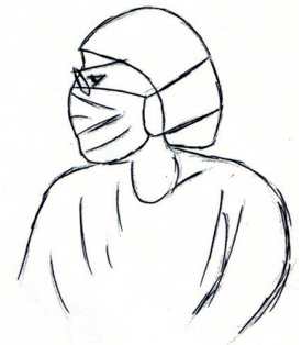
Solène au bloc opératoire