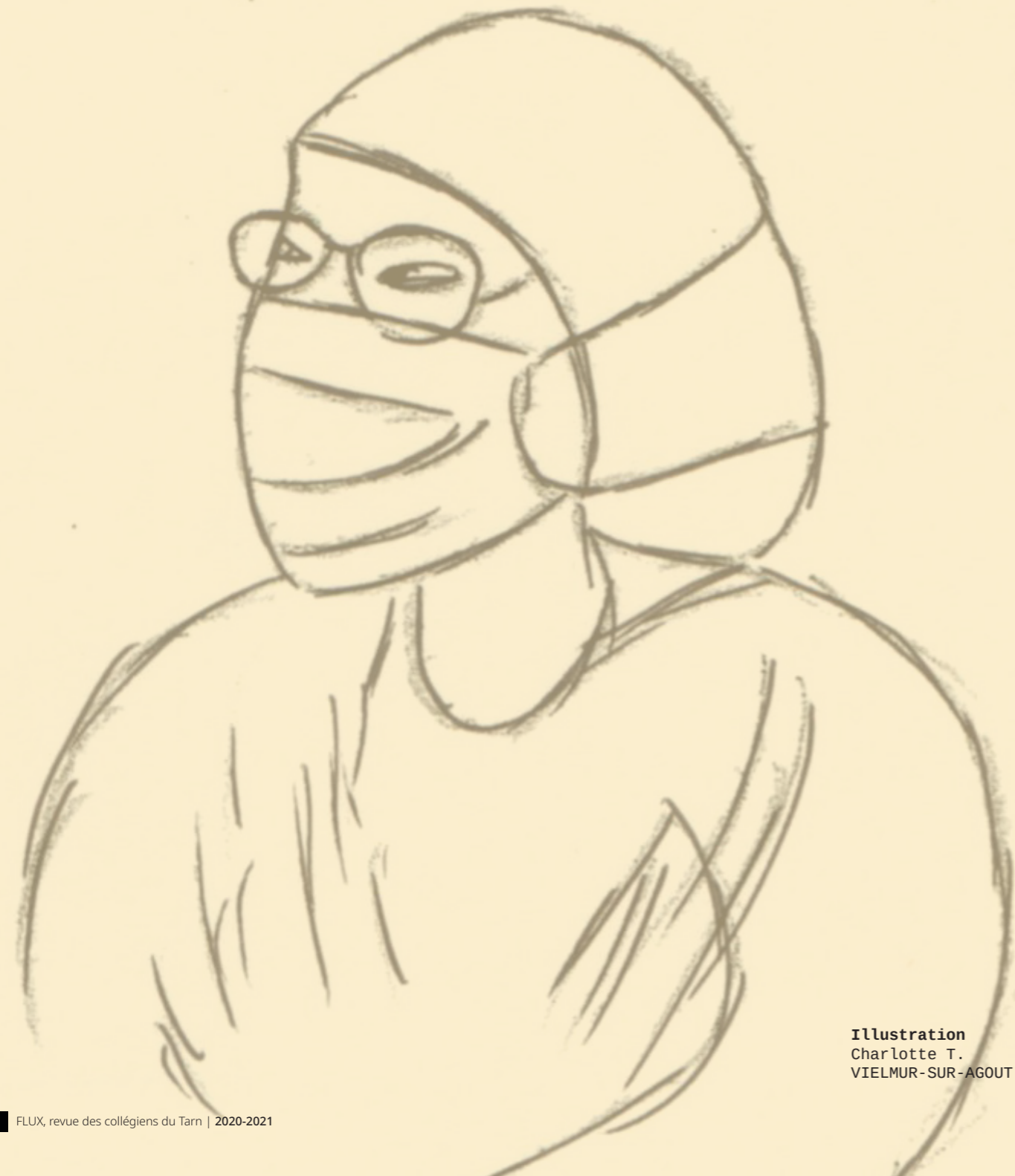
Illustration Charlotte T. VIELMUR-SUR-AGOUT

Le contact avec les gens. L'univers médical est un monde qui me passionne. La reconnaissance des personnes dont je me suis occupée et qui me remercient.